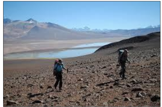
Les premiers pas vers le sommet