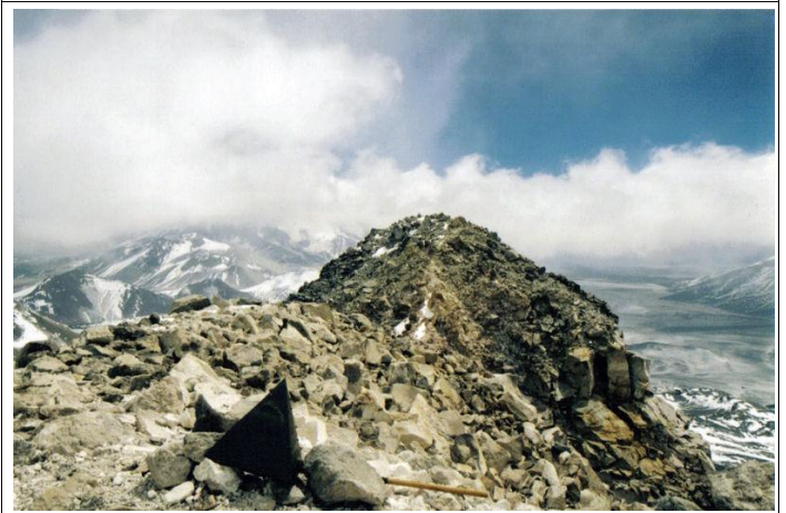
Vue du sommet de l'Ojos Del Salado situé en Argentine.

L'Echo de Gers vous tiendra informé de la suite de leur exploit.